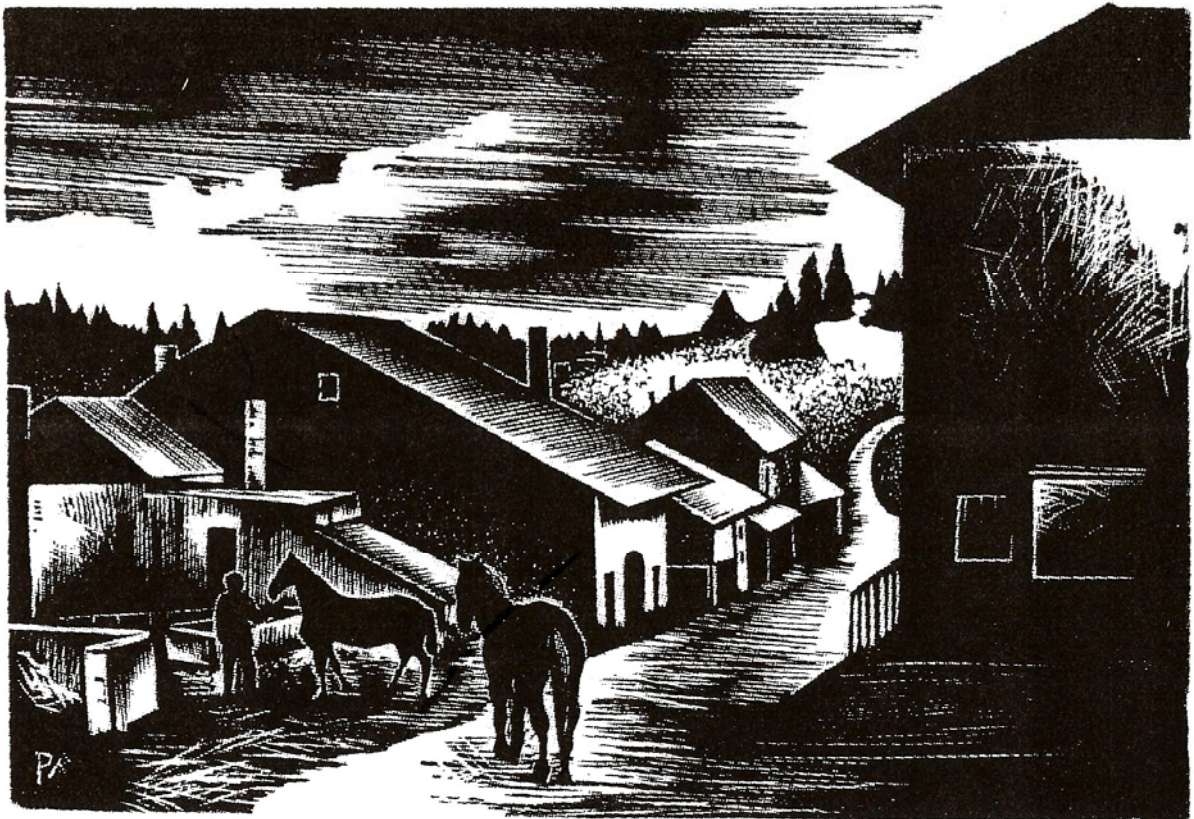
Toute une ambiance qu'a su reconstituer avec force le graveur Pierre Aubert entre 1955 et 1957.