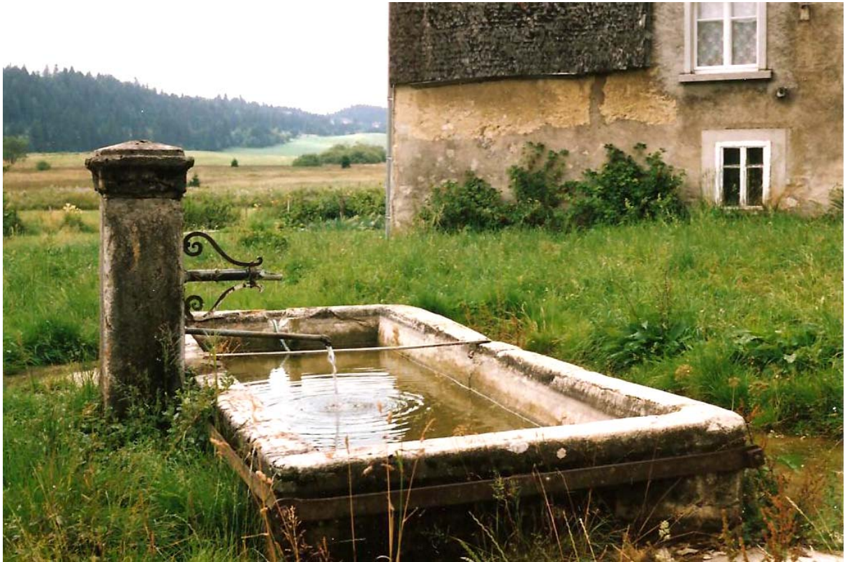
La fontaine a encore sa chèvre de 1825, et surtout, elle coule ! Et c'est beau, une fontaine avec de l'eau !