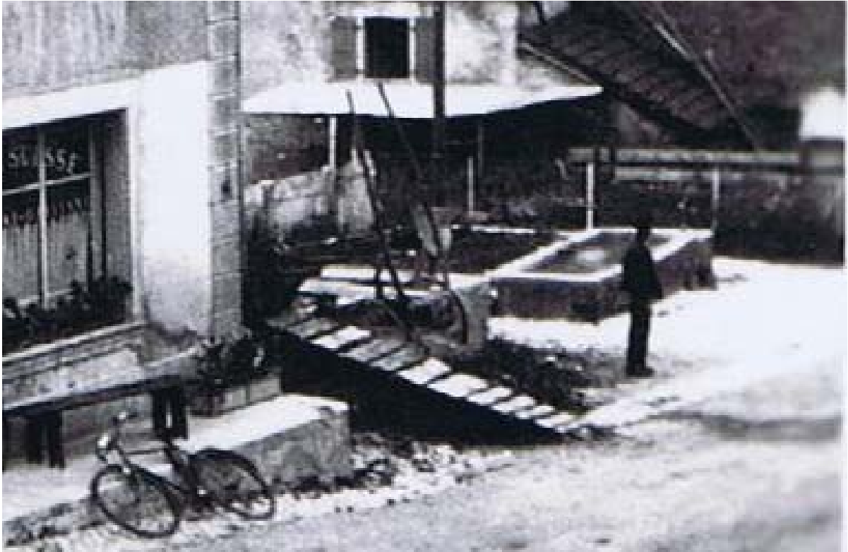
La fontaine du milieu en 1942-1943